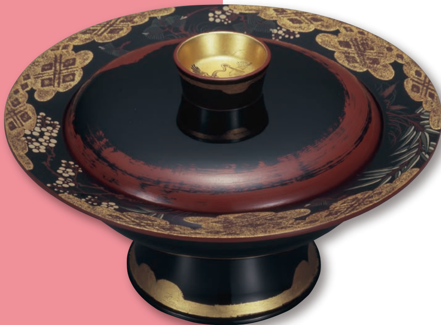
上から 石黒宗彦《白地黒絵魚文扁壺》1940-41年頃 鹿兒島寿蔵《紙塑人形 さめのちがみのおとめ》1960年 松田権六《長生の器》1940年 全て東京国立近代美術館蔵