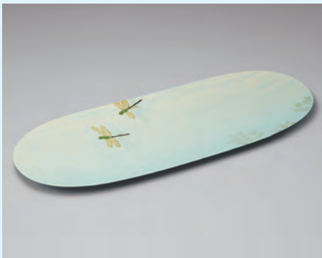
文部科学大臣賞 乾漆存清盛器「対決」/辻 孝史