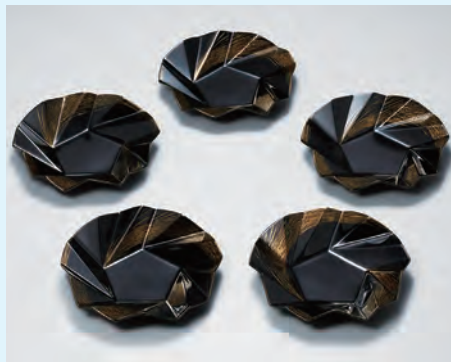
東京都教育委員会賞 乾漆組鉢「旋」/奥窪聖美