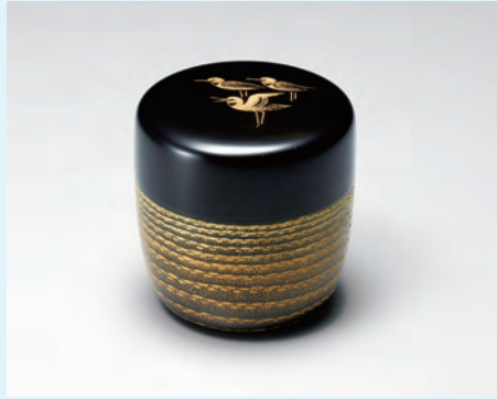
花塗沈金棗「千鳥」 前 史雄(重要無形文化財保持者)