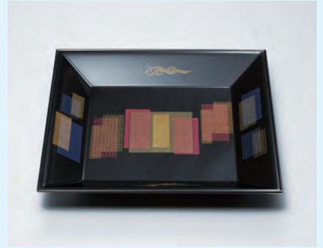
沈金象嵌方盆「窓」 山岸一男(重要無形文化財保持者)